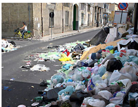
Foto: Napoli; Nihče noče smeti v svoji bližini. Smeti bi naj bile v zabojnikih in redno pobrane.

Le malo objektov pri nas je zgrajenih tako, da imajo v pritličju ali kleti posebej pripravljen prostor za smetnjake. Prostor za smetnjake je večinoma načrtovan zunaj stavbe. Tudi stare zgradbe v mestnih središčih nimajo posebnega prostora, zato so zabojniki postavljeni na ulice ali na dvorišča stavb. Smetnjakov je dandanes vedno več. Ekološke težnje po ločenem zbiranju odpadkov namreč zahtevajo vedno več zabojnikov, nameščajo se zabojniki za zbiranje stekla, papirja, plastike, kovin, bioloških odpadkov, itd. Med zanimivostmi sem zasledila celo novičko, da bodo v finski prestolnici Helsinki postavili smetnjake, ki bodo zažvrgoleli "hvala", ko bodo uporabniki vanje odvrgli smeti. Ni sicer nič pisalo o tem, če znajo ti tudi presoditi ali določen odpadek res spada med zeleno vsebino! Govoreči smetnjaki so poželi uspeh že tudi v mnogih drugih evropskih mestih. Domišljija seveda nima mej, dejstvo pa je, da je ločeno zbiranje odpadkov za našo bodočnost nujno potrebna. Torej moramo nekako poskrbeti, da bodo vsi različni zabojniki enostavno dostopni, zato, da jih bomo za ločeno deponiranje tudi zares uporabljali. Vsekakor pa naj ne bi kazili našega okolja, nasprotno: naj bi bil tudi ta prostor oblikovno zanimiv, naj bi odgovarjal zahtevam modernih urbanih ureditev, naj torej ulice in dvorišča postanejo urejena, naj ta urejenost dvigne ugled kraja in navsezadnje naj urejenost okolice naredi njihove lastnike zadovoljne in jih razbremeni pretiranih stroškov in vzdrževanja.