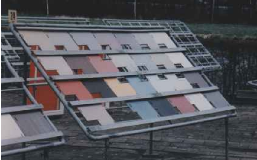
Slika 4: HPL plošče izpostavljene zunanjim vplivom na preiskusni postaji TNO v Delftu.