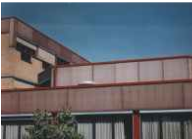
Slika 1: Praktični primer razbarvanja melaminske HPL fasade na šolskem objektu.

Ko so v sedemdesetih letih prejšnjega stoletja razvili lahke in kemično odporne visokotlačne laminatne plošče (HPL plošče), so jih najprej uporabljali v interierju laboratorijev, bolnišnic, mokrih prostorov, kot predelne stene v gradbeništvu ipd. Pri vseh tovrstnih aplikacijah je bila uporaba HPL plošče zaradi odpornosti proti vlagi, dolgotrajne strukturne trdnosti, odpornosti proti udarcem in kemične odpornosti najboljša izbira. Ko pa so plošče iste kakovosti uporabili na prostem, se je sčasoma pokazalo, da so občutljive na vremenske vplive.