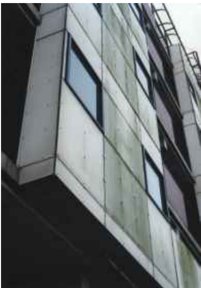
Slika 2: Praktični primer posedanja umazanije na melaminski HPL fasadi stanovanjskega objekta

Ta problem so v prvi fazi rešili tako, da so laminatne plošče iz fenolnih smol in lesnih vlaken prevlekli z dodatnim zaščitnim slojem (melaminske smole). Kljub temu da se melaminske smole na prostem obnašajo