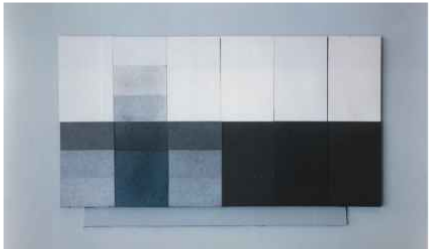
Slika 3: Korelacija med vremensko obstojnostjo in posedanjem umazanije. Test s 6 vzorci levo: melaminska površina. Test s 6 vzorci desno: EBC PUR akrilatna površina. Oba tipa v isti barvi: beli in rjavi. Vsaka serija od treh od leve proti desni: umetno staranje s ksenonskim testom 1200 U za 1000, 2000 in 3000 ur (3 cone), isti nato tretiran s sajam, isti nato tretiran s sajam in očiščen.

Ta problem so v prvi fazi rešili tako, da so laminatne plošče iz fenolnih smol in lesnih vlaken prevlekli z dodatnim zaščitnim slojem (melaminske smole). Kljub temu da se melaminske smole na prostem obnašajo