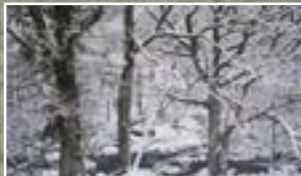
NW01 – Loft Grey golobje siva Vtis blago sušečega se lesa – ustvarjalno, sodobno in avantgardno.