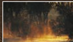
NW 09 – Wenge Ponovni razcvet elegancje 60. let v temnem lesu – zlasti za barve s poudarkom – tradicionalno, internacionalno s pridihom prvovrstnosti.