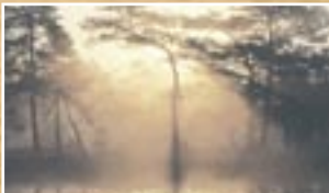
NW02 – Elegant Oak elegantni hrast Spominja na živahen italijanski lahki hrast – mladostno, ljubko in barvito.