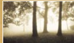
NW06 – Montreaux Amber Montreaux jantar Naravna rumena toplota – neposredno, naravno in živahno.