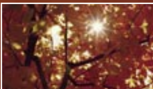
NW04 – Pacific Board Pacifik Občutek lesa z oceana ali njegove bližine – klasično, eksotično in stilno.