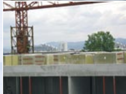
Rockwool v gradnji