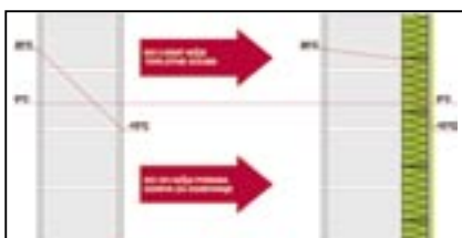
Slika 1: potek temperature preko neizoliranega in izoliranega zidu.

Pri izvedbi toplotne izolacije zunanjih zidov nam gradbeno-fizikalne zakonitosti narekujejo, da izolacijo vedno položimo na zunanjo – hladno stran zidov. Prehod toplote in padec temperature preko zunanjih zidov, kjer ni izvedena toplotna izolacija, poteka linearno. Takoj ko pa uporabimo toplotno izolacijo, se prehod toplote enormno zniža, praktično 80 % temperaturnega padca pa se izvrši v plasti toplotne izolacije (glej sliko 1).